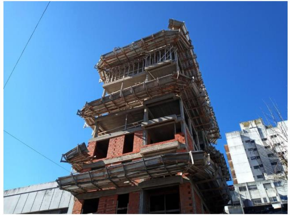
EN LA COMUNIDAD SE VEYER 600 OBRAS PARALIZADAS | ANDREA BOSCH

Pidió habilitar la actividad con protocolos, por su influencia en "la reactivación del empleo y la llegada de inversiones"