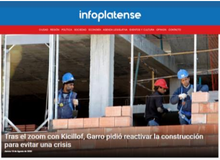
Tras el zoom con Kicillof, Garro pidió reactivar la construcción para evitar una crisis