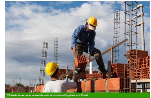
El intendente cree que es necesaria la vuelta de la construcción privada en la Ciudad